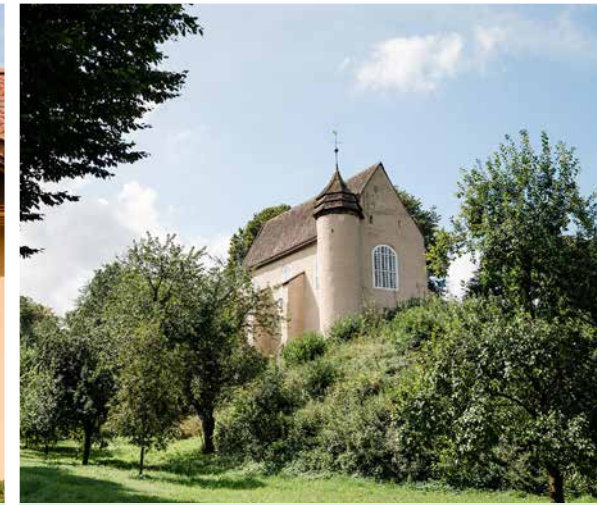
Schloss Varenholz ± 2,0 km