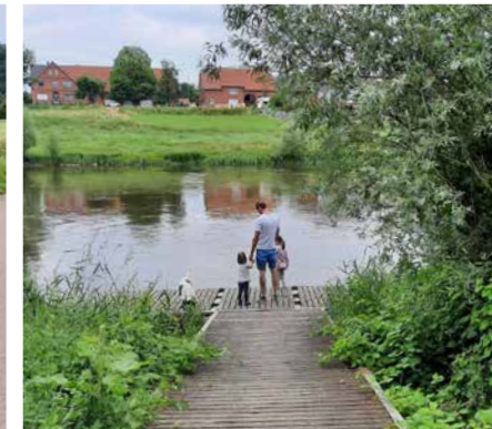
Weserfähre ± 2,5 km