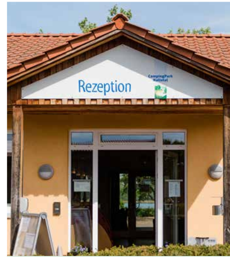
Startpunkt Campingpark Kalletal Starting Point

Highlight of the tour is the Weser ferry Varenholz-Veltheim, which makes it possible to cross the Weser on weekends and public holidays. On the other side of the Weser, the cycle tour continues in the flat countryside towards Veltheim. Here you will notice the free-standing Veltheim windmill from 1903, whose stone mill tower stands out against the surrounding fields and meadows in summer.