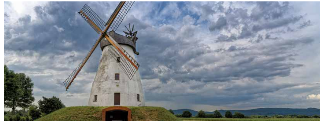
Windmühle Veltheim ± 5,0 km