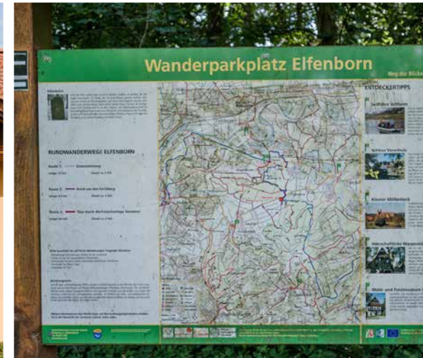
Wanderparkplatz Elfenborn ± 6,1 km