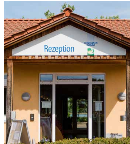
Startpunkt Campingpark Kalletal Starting Point

Lipperland. Hiking benches invite you to take short breaks. The shady path winds slightly uphill through the beautiful mixed forest. A soft splashing accompanies you in many places along the way. It was not the elves who gave the area its name, but eleven springs that run through the ground in the Langenholzhausen forest. At the end of the route you will pass an impressive boundary stone from 1669.